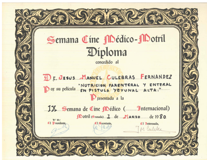
Figura 1. Diploma concedido a la película Nutrición parenteral y enteral en una fistula yeyunal alta en la IX Semana de Cine Médico de Motril en 1980